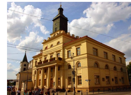
Ratusz w Lublinie

Lublin, 10-11 października 2009 ul. Północna 3 (Kasyno Policyjne)