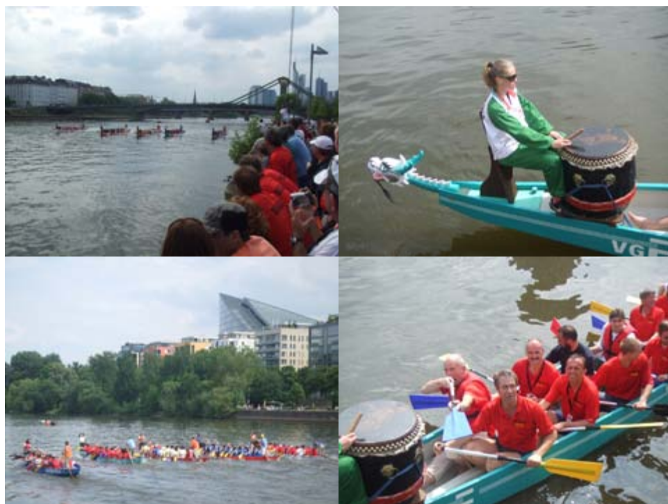
powyżej: wyścigi łodzi smoczych (Dragonboats) kończyły imprezę...